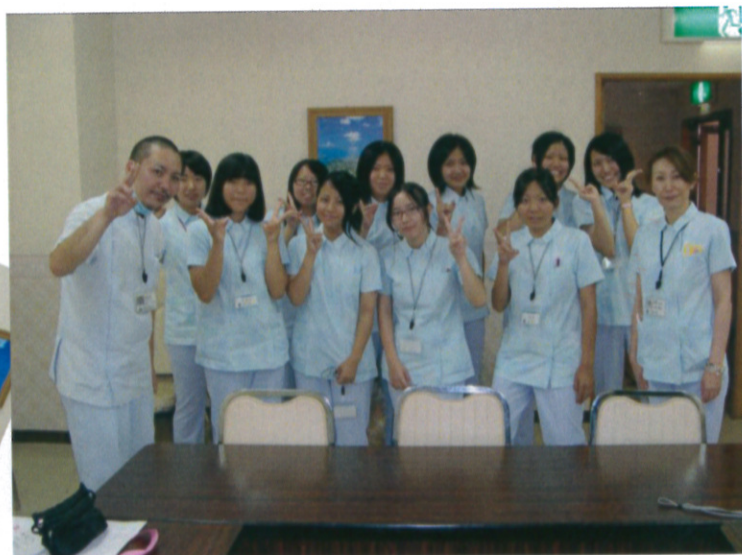
師長（両端）と那覇西高校生10名