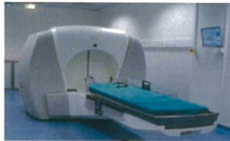
11月から稼働するガンマナイフ新機種パーフェクション