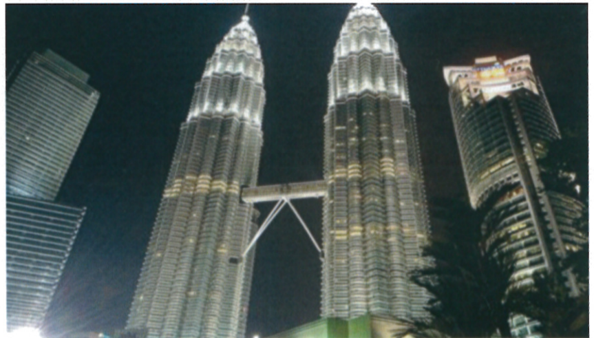
1997年のスパイダーマンの映画に使われた八十八階建てのペトロスツインタワー

ホテルの星の数を落として料理のランクを上げるプランは、ツインタワーのNight spotでショーを見ながらの食事である。1000の座席を埋め尽くすように数十の言葉の乱舞である。ヒンズー教徒の多い南アジアの民族衣装、サリーのカラフルな衣装をまとう女性は際立っていた。終ぞ彼女達が料理の受け皿を持って歩く姿は見なかった。