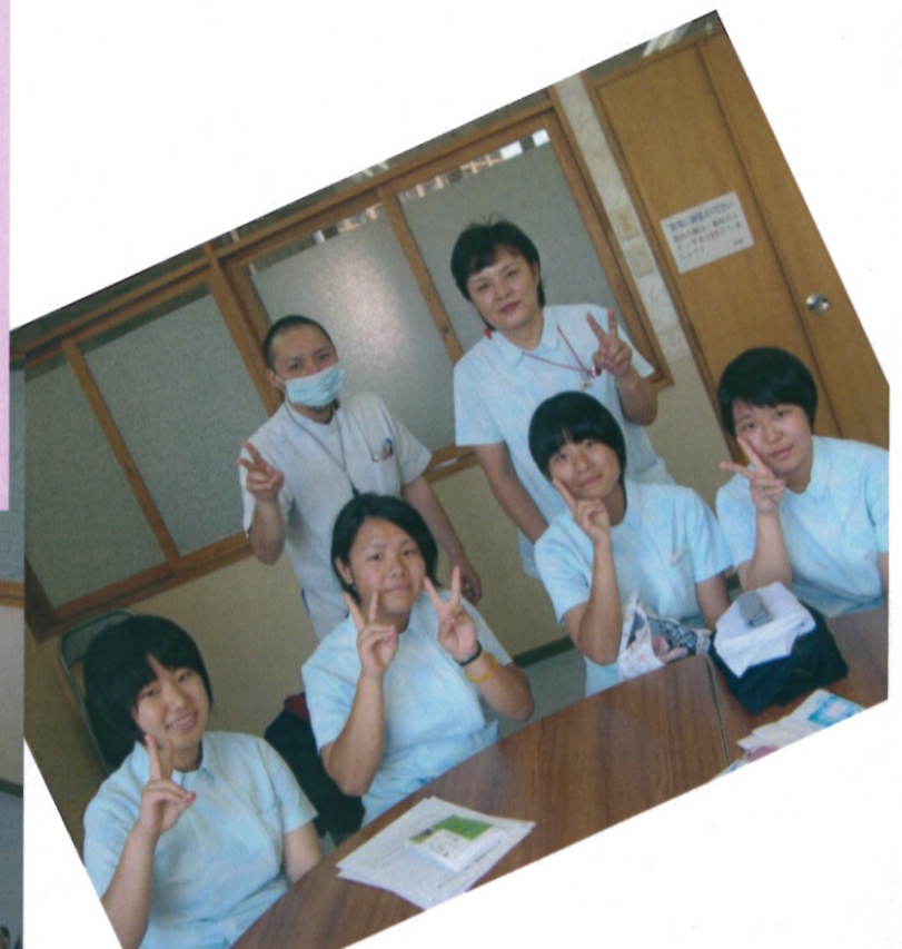
座間味中学校の生徒(下段左)と陽明高校の生徒(下段右三名)